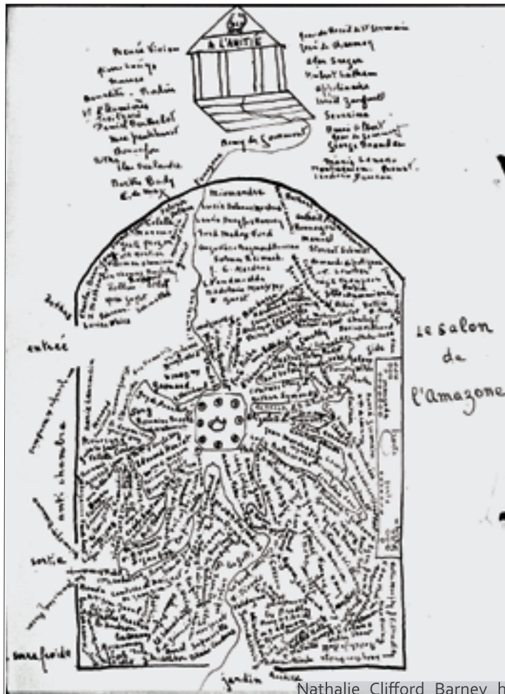
Nathalie Clifford Barney hat diesen Plan gezeichnet. Der Salon de l'Amazone ist der von ihr generierte Ort in der Rue de Jacob 20, Paris. Ein lustvolles und geistreiches Milieu im Paris der 1920er.

Wie beeinflusst das in der Wand Liegende die Räume davor und dahinter?