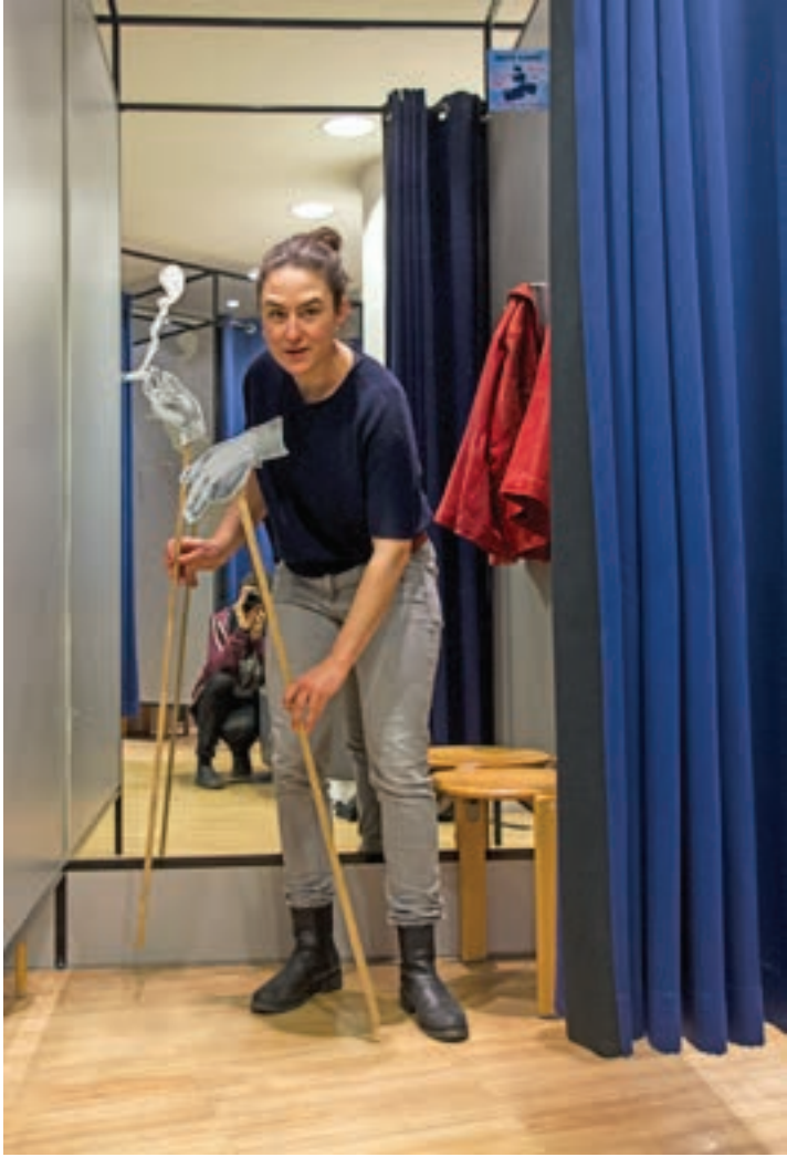
Theresa Schnell, 2017: Rauchende Frauen, digitale Fotografie

Irène Mélix, Theresa Schnell, 2017 Konzept und Satz: Theresa Schnell 25 Stück, nummeriert & gestempelt